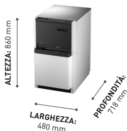
Cash Rack Altezza: 860 mm Larghezza: 480 mm Profondità: 718 mm